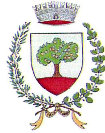
Comune di Pomarolo