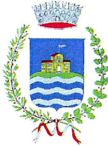
Comune di Villa Lagarina