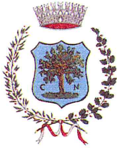
Comune di Nogaredo